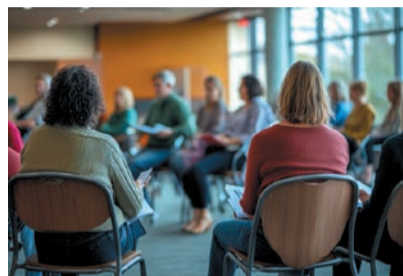
Foto: Gesprächs- und Diskussionsrunde