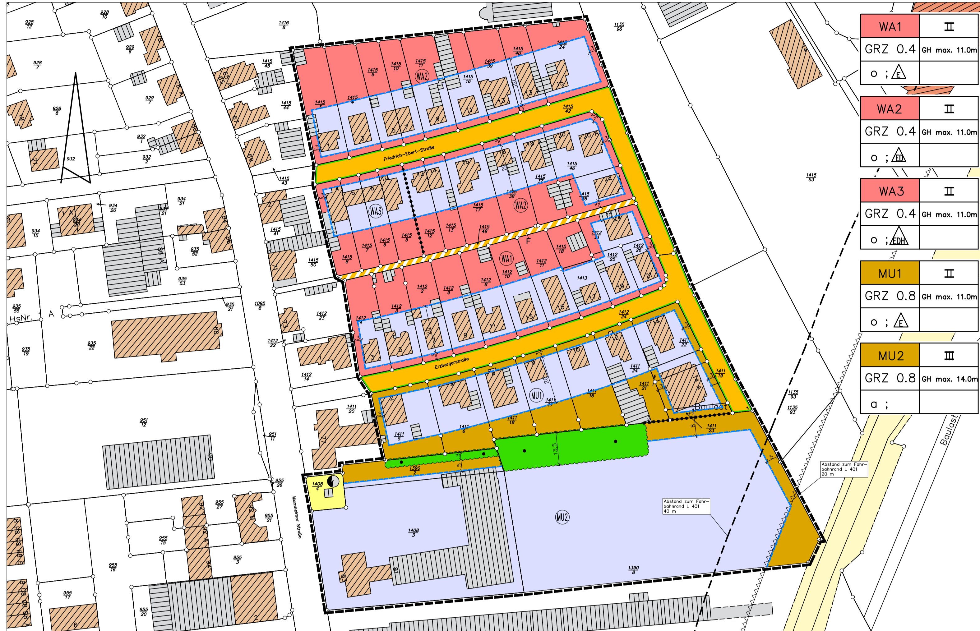
"Datengrundlage: Geobasisinformationen der Vermessungs- und Katasterverwaltung Rheinland-Pfalz - (Zustimmung vom 15. Oktober 2002)".